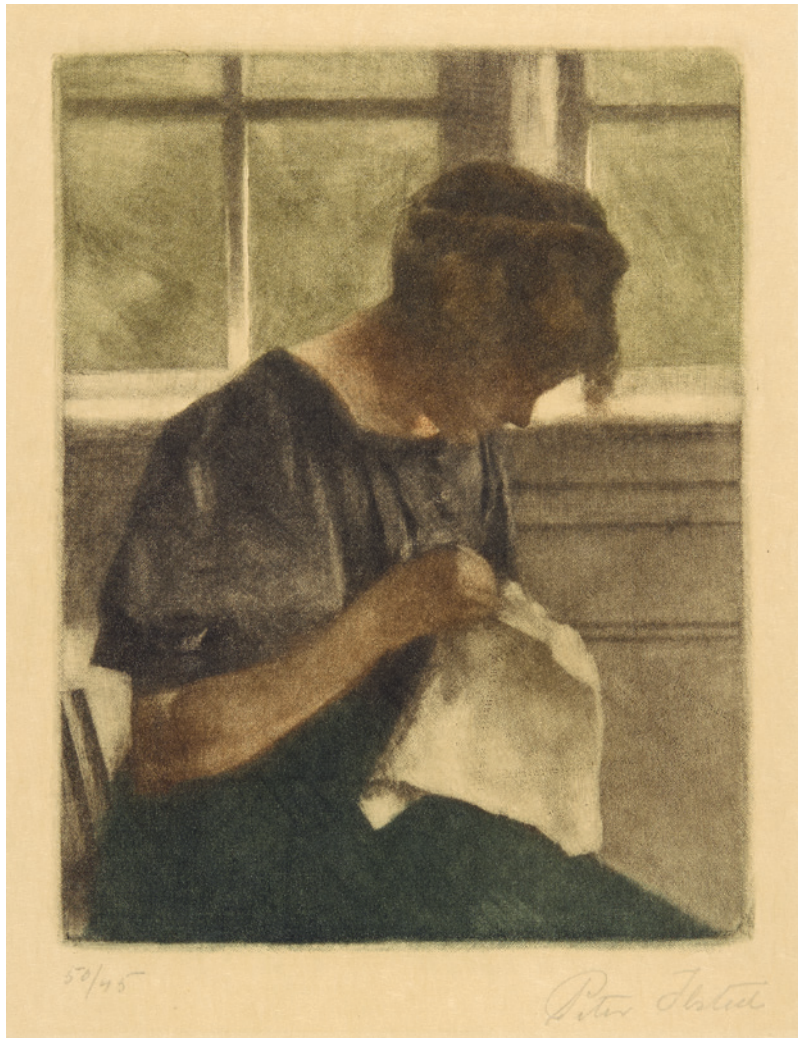
Peter Ilsted Ung pige, der syer, 1910 Ankauf