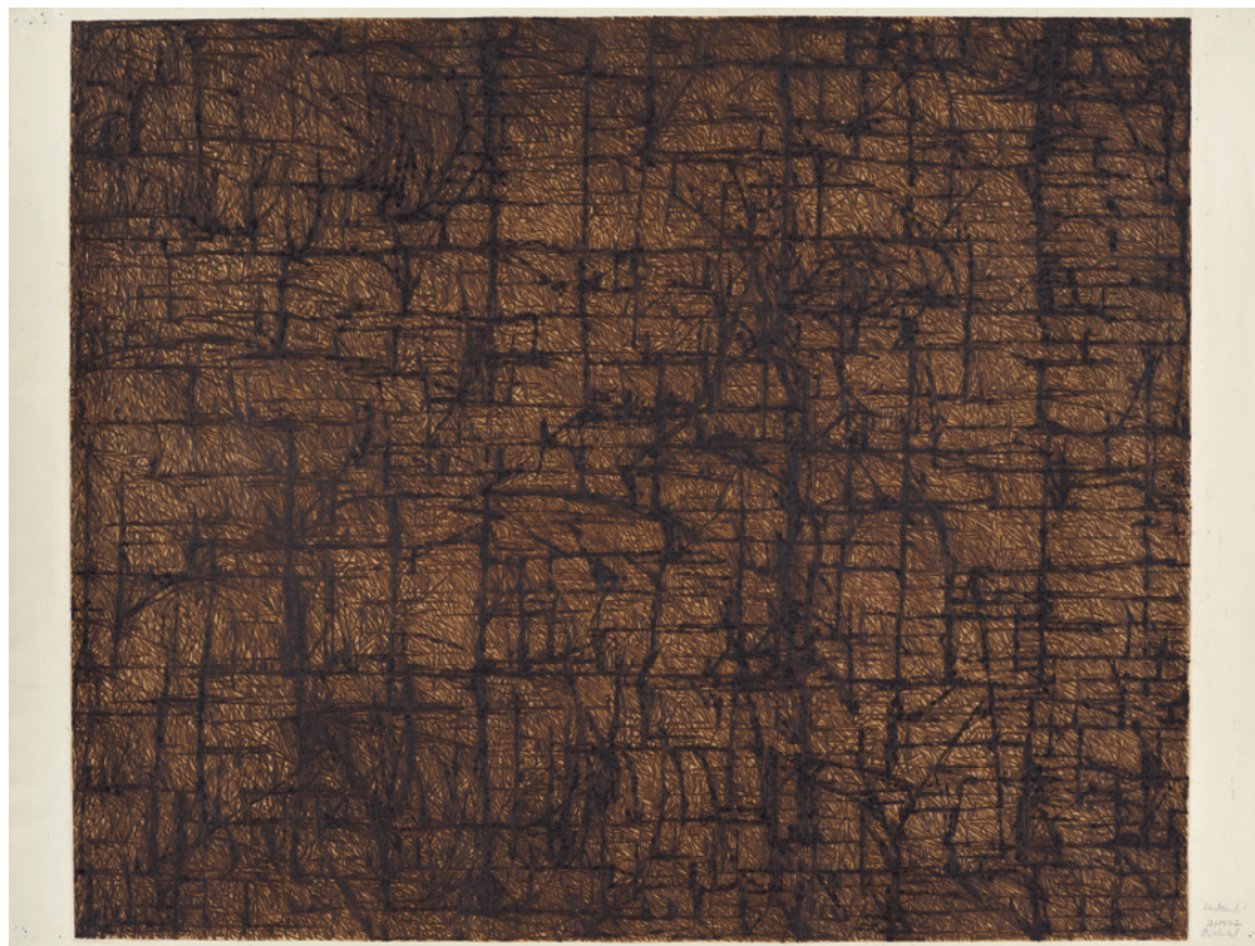
Peter Wechsler Grosses Liniengewimmel (Probedruck), 7.1977 Geschenk des Künstlers