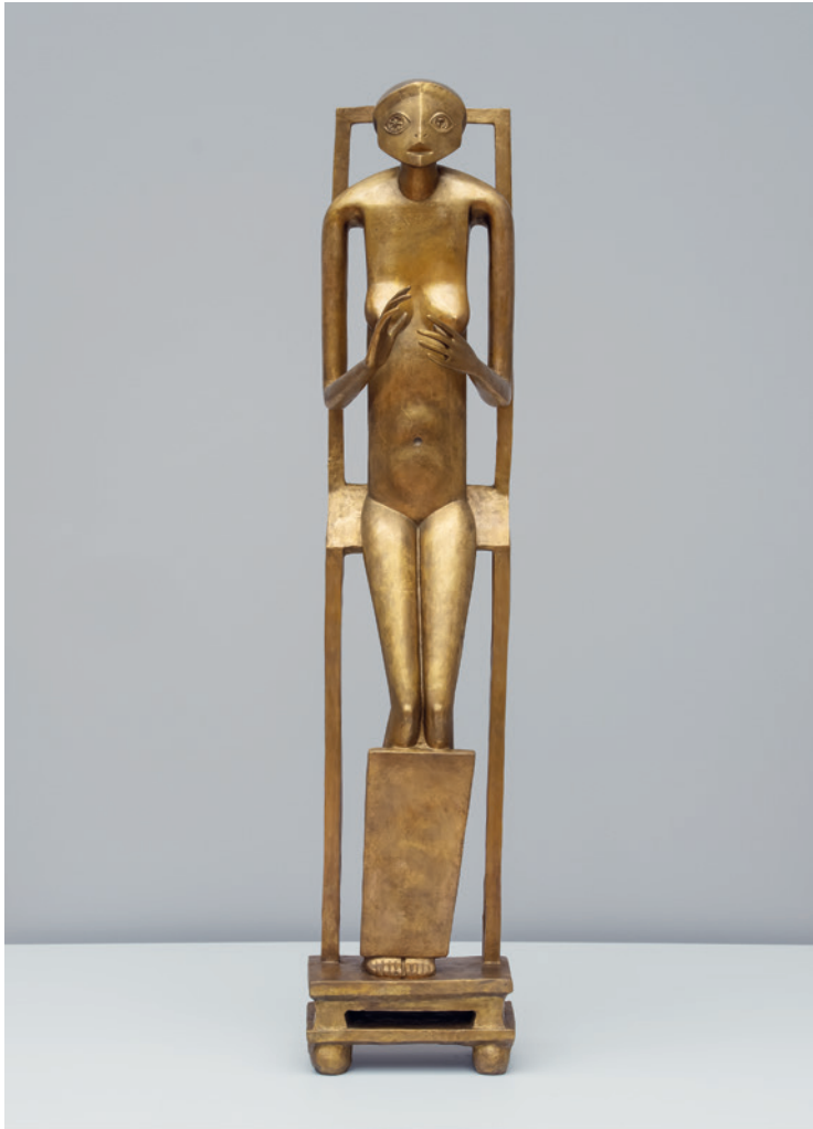
Alberto Giacometti L'Objet invisible, 1934–1935 Dauerleihgabe Alberto Giacometti-Stiftung / Privatsammlung Schweiz, 2025