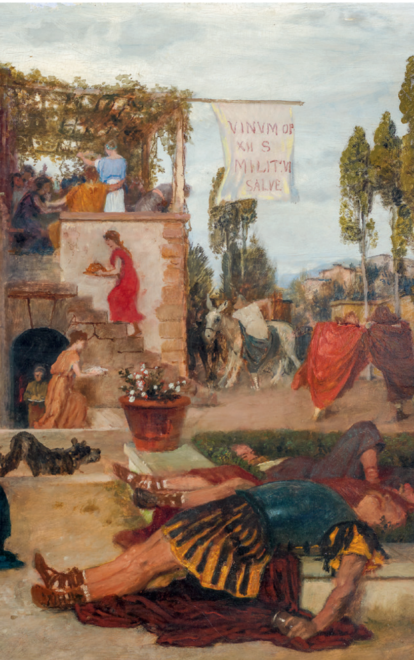
Arnold Böcklin Bacchanale, um 1886 Schenkung aus Privatbesitz