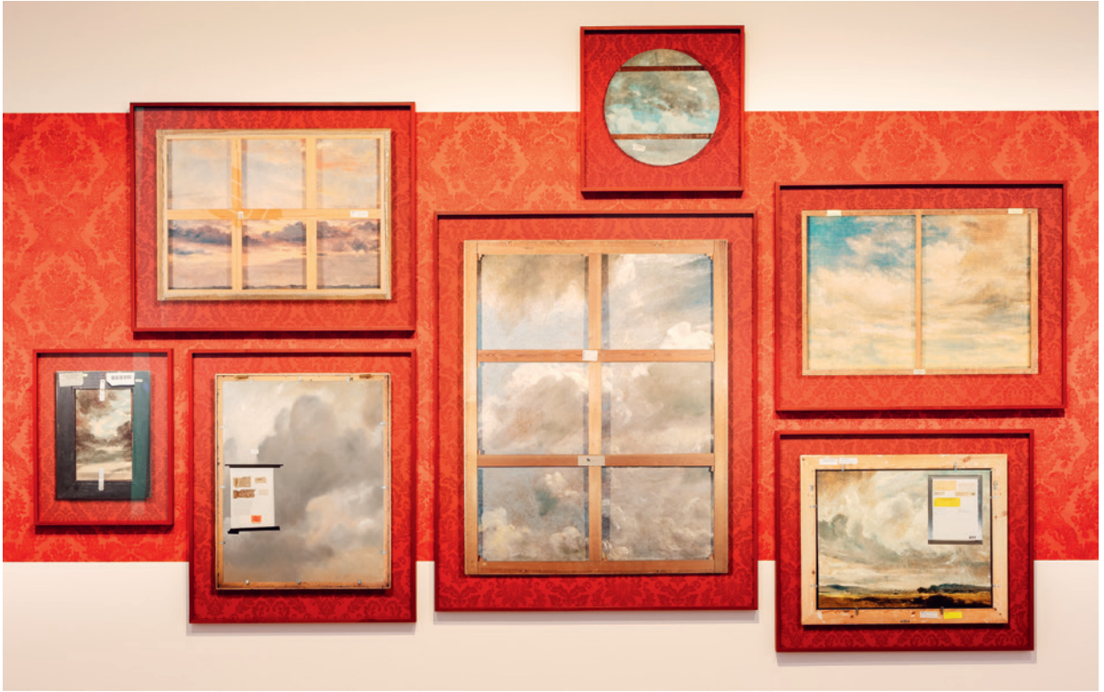
Walid Raad Epilogue II: The Constables, 2021 Dauerleihgabe Vereinigung Zürcher Kunstfreunde