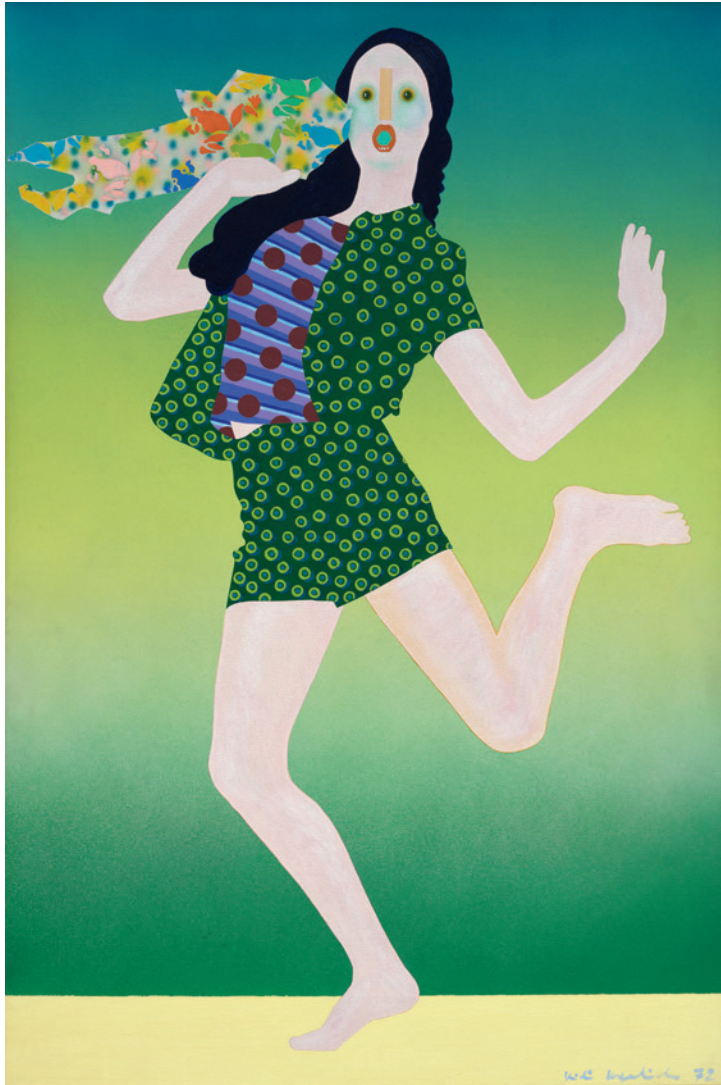
Kiki Kogelnik Express, 1972 Dauerleihgabe Vereinigung Zürcher Kunstfreunde