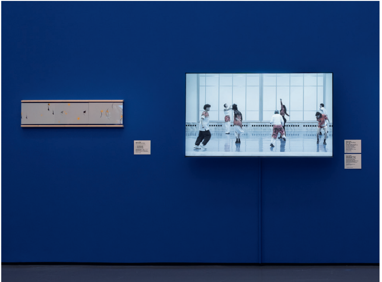
Izidora I LETHE RE_APPEAR. Aus der Serie «APROPOSITIONS ( )», 2024 Ankauf