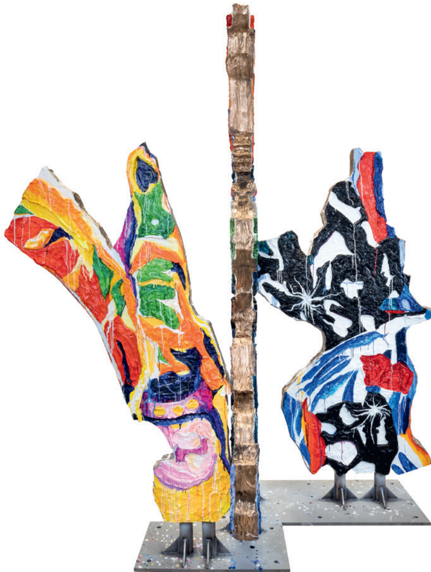
Ida Ekblad SATYR SATYR SABOTAGE, 2025 Dauerleihgabe Vereinigung Zürcher Kunstfreunde