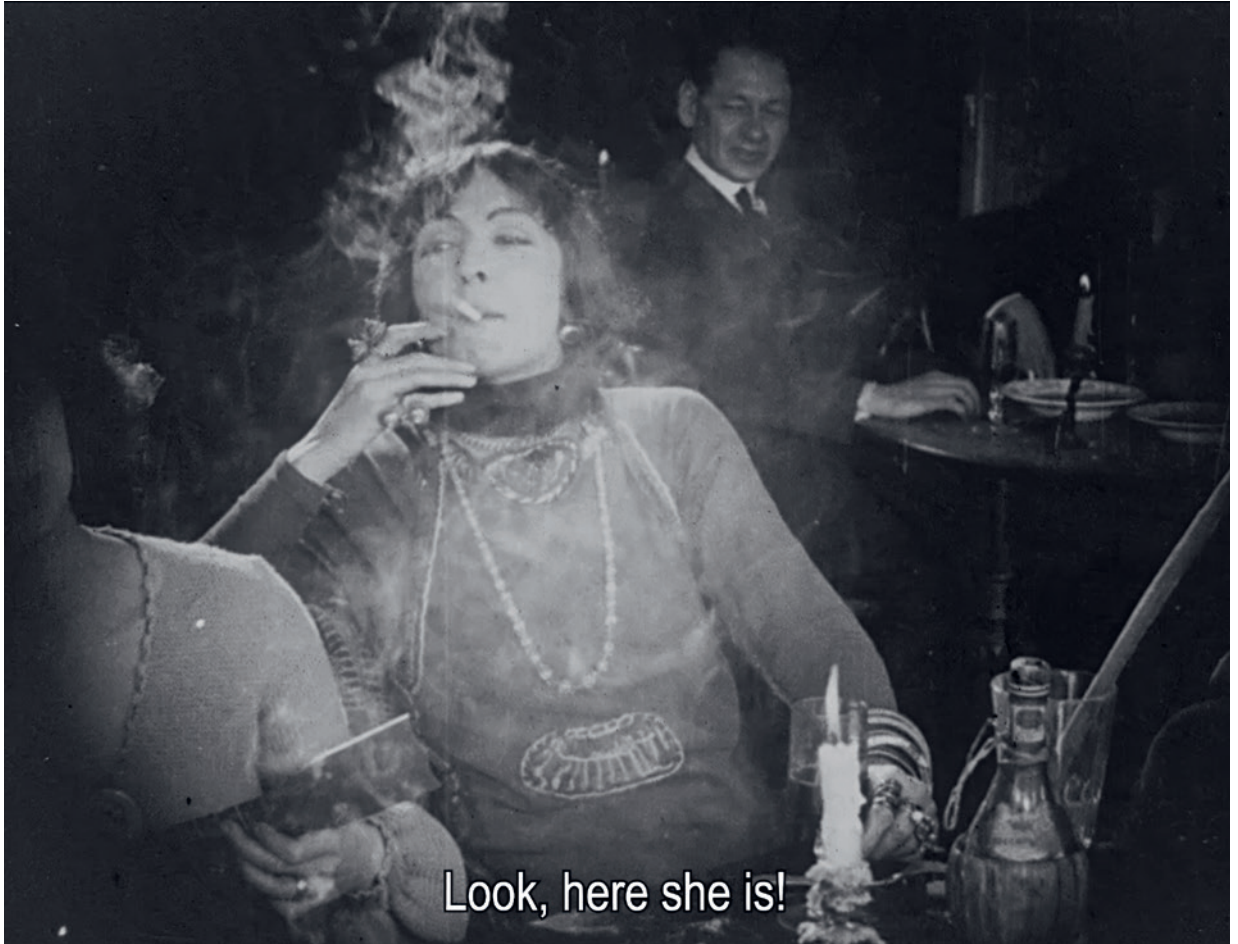
Barbara Visser Alreadymade II, 2024 Ankauf